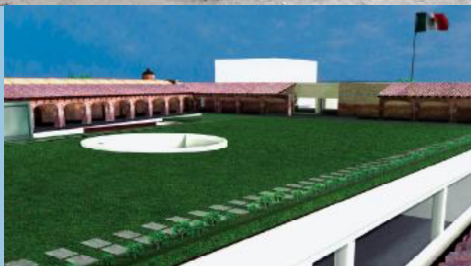
LOS CREADORES. El proyecto es del arquitecto Francisco Serrano Cacho y la construcción es obra de Proube del Bajío. La inversión fue de 12 millones de dólares.

A decir del ex primer mandatario mexicano, "el lugar no es propiedad de Vicente Fox. Mis hermanos me regalaron el terreno y yo hice del Centro una asociación civil que se mantiene con aportaciones generosas de empresarios".