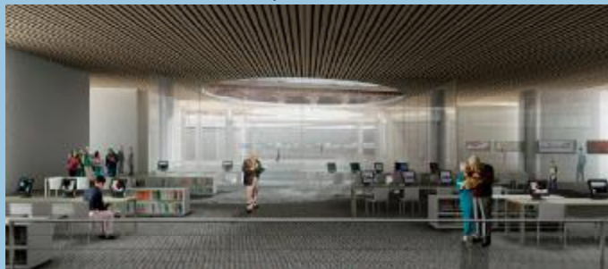
EL TESORO DEL SABER. El lugar tiene contemplados varios edificios. El que corresponde a la biblioteca será subterráneo.