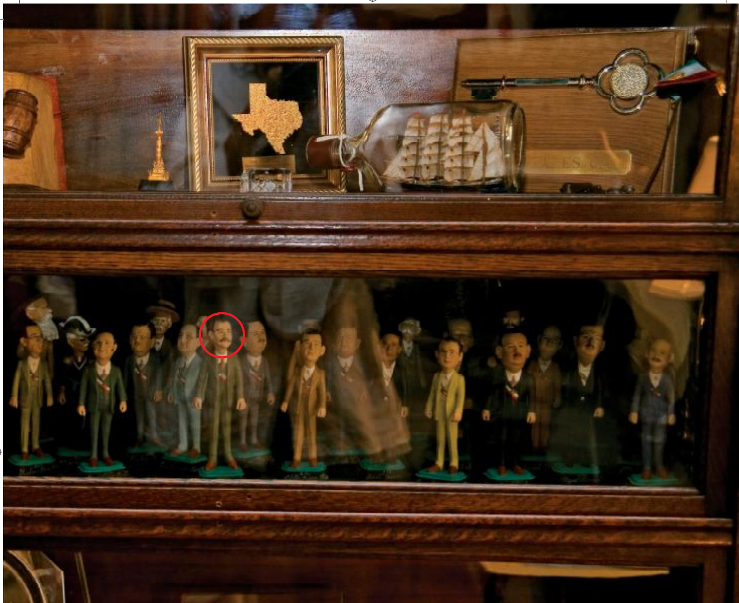
JUNTOS PERO NO REVUELTOS. Fox tiene una colección de muñequitos en miniatura que representan a los presidentes que ha tenido México, incluyéndolo a él. Están Porfirio Díaz, Álvaro Obregón, Lázaro Cárdenas, Gustavo Díaz Ordaz, José López Portillo, Miguel de la Madrid y Carlos Salinas de Gortari, entre otros.

—Perfecto, ¿cuándo te veo? —le pregunté—.