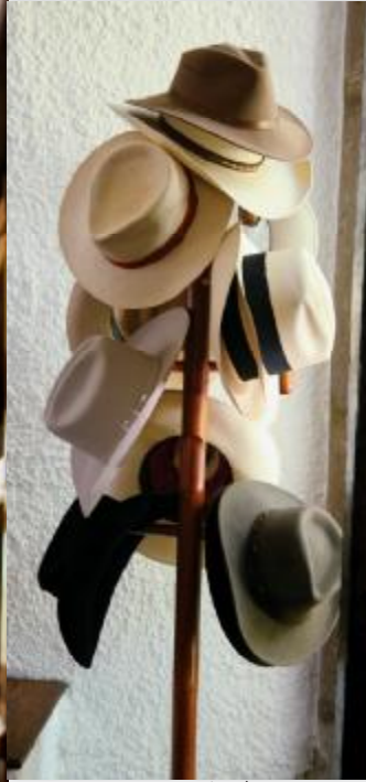
RANCHERO DE CORAZÓN. Éstos son los sombreros favoritos del ex Presidente.