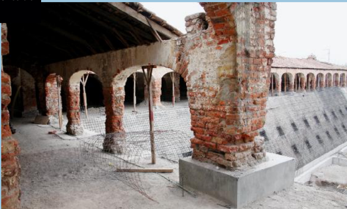
ASÍ LUCE POR AHORA. La primera piedra del Centro fue colocada en enero de este año y se espera que esté terminado a finales de 2007.

En el lugar donde hace años se encontraban las caballerizas de la hacienda San Cristóbal, en Guanajuato, actualmente se construye el Centro Fox que contará con: un auditorio con capacidad para 500 personas, una sala de bienvenida con un cupo para 60 visitantes, una biblioteca para atender 300 usuarios la cual albergará 25 mil volúmenes sobre democracia, liderazgo, transparencia, equidad de género, combate a la pobreza y políticas públicas, así como un acervo digitalizado sobre la gestión gubernamental 2000-2006 con más de 3 millones de documentos para consulta en línea; una explanada con capacidad para 3 mil asistentes en donde se podrán presenciar eventos y espectáculos artísticos, un área donde se exhibirán de manera permanente los obsequios que recibió el ex presidente, así como una cafetería-restaurante para 50 comensales.