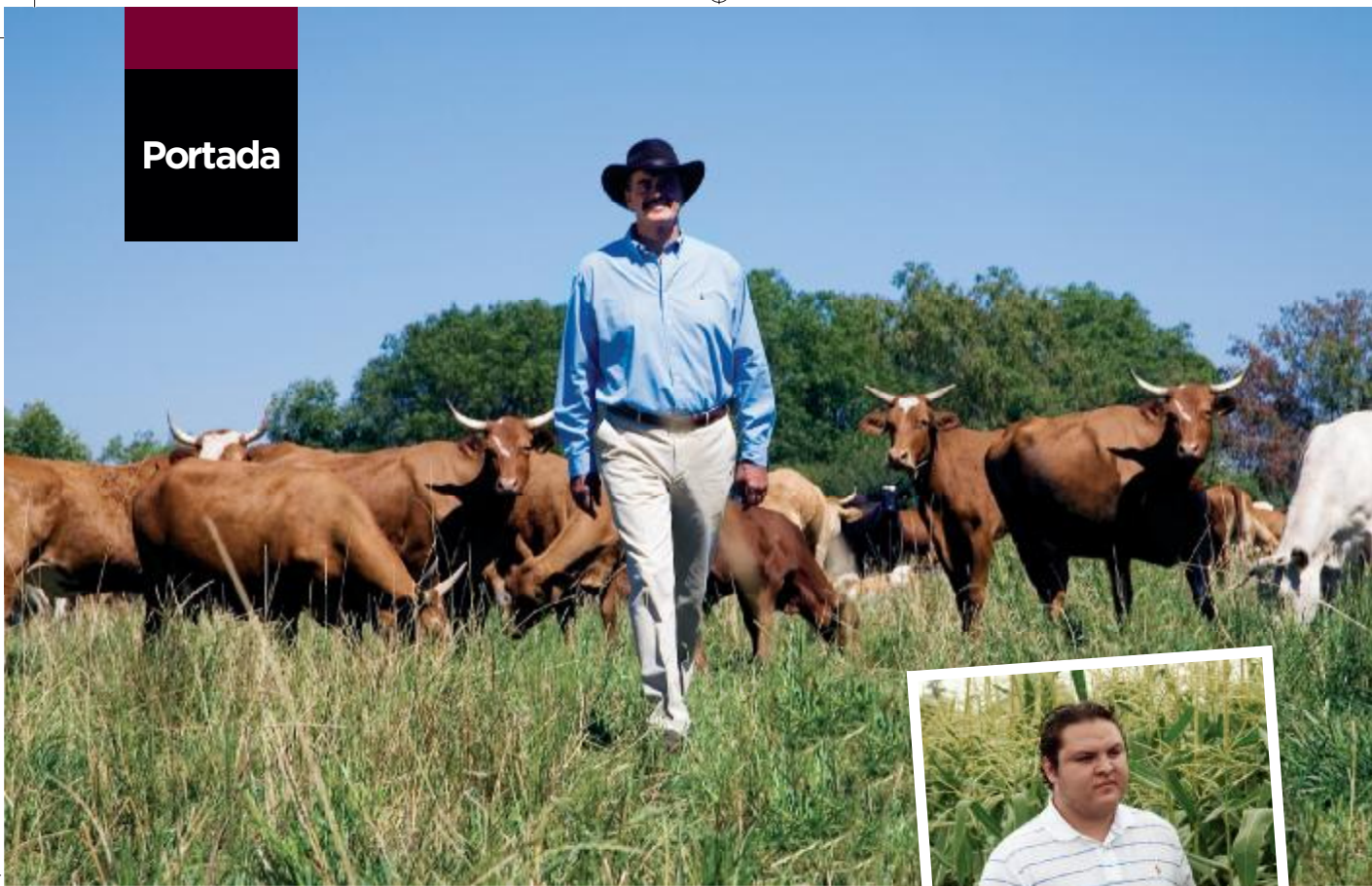
CAMPIRANO. Además de criar ganado, en el rancho San Cristóbal se cultiva brócoli, papa y maíz.