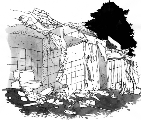
Palacio Municipal de Ixtaltepec.