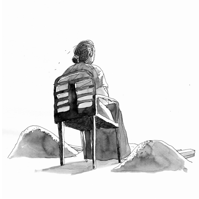
Atardecer en Ixtaltepec.