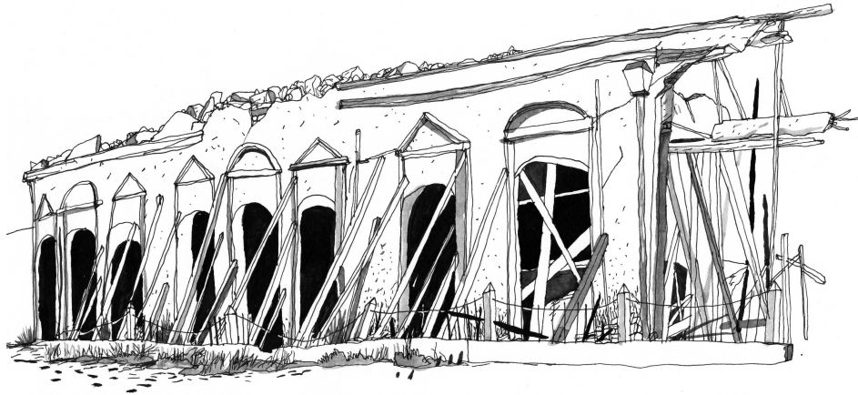
Casa de la Cultura de Ixtaltepec.

“Hay una fundación: Tengo Derecho a mi Casa Tradicional...” (María Elena).