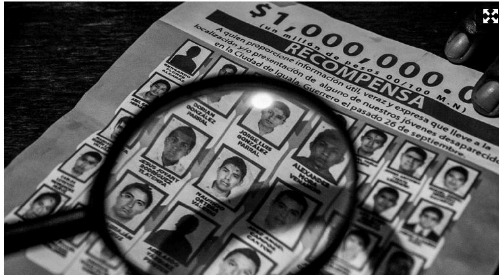
Normalistas desaparecidos.

La desaparición de los estudiantes ha herido los corazones de 43 familias y marcado a toda una nación