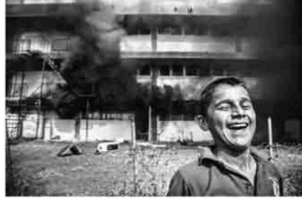
Protestas Miembros de la Coordinadora Estatal de Trabajadores de la Educación de Guerrero quemaron las instalaciones de la SEP en Chilpancingo.

#YaMeCansé El año pasado, tras una conferencia de prensa, el entonces procurador general de la República, Jesús Murillo Karam, expresó esta famosa frase, que se convirtió pronto en un clamor nacional por justicia y un rechazo al gobierno de Peña Nieto. Murillo trataba de evadir más cuestionamientos de la prensa en torno al caso Ayotzinapa.