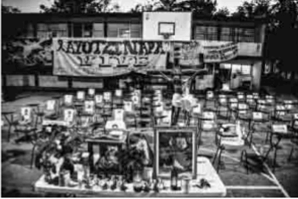
Recuerdos La normal se ha convertido en el bastión de la resistencia de padres de familia y normalistas que buscan a los jóvenes. En el patio se observa un altar con sillas en honor a los desaparecidos.