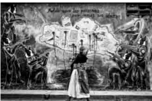
Podrán morir las personas, jamás sus ideas Artistas locales realizaron murales como parte de los festejos del Día de Muertos; en esta ocasión, fueron dedicados a los estudiantes asesinados durante los hechos del 26 de septiembre y a los 43 estudiantes desaparecidos.