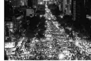
#TodosSomosAyotzinapa Más de 80 mil personas marcharon el año pasado en la Ciudad de México, en demanda de justicia; el movimiento de Ayotzinapa ha cobrado fuerza también en el extranjero.