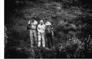
La Investigación El Ministerio Público federal inspeccionó un basurero en Cocula, donde presuntamente los muchachos fueron asesinados e incinerados por miembros del cártel Guerreros Unidos.