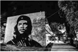
La escuela normal rural Raúl Isidro Burgos En ella estudiaban los 43 estudiantes que fueron desaparecidos. Esta es una de las 17 escuelas normales rurales que existen en el país, las cuales han ido desapareciendo por la falta de presupuesto federal. Fueron creadas para dar educación a los pueblos más pobres. La formación de maestros se da en buses socialistas.