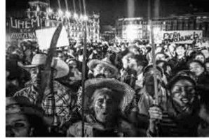
Demandas Padres de los 43 normalistas desaparecidos han realizado mítines en el DF exigiendo la aparición con vida de sus hijos; miles de personas acudieron en apoyo a los familiares.