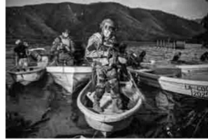
La búsqueda Agentes de la Gendarmería, acompañados de autodefensas de Guerrero, realizaron un operativo en lanchas por el río Balsas, en Cocula, en busca de restos.